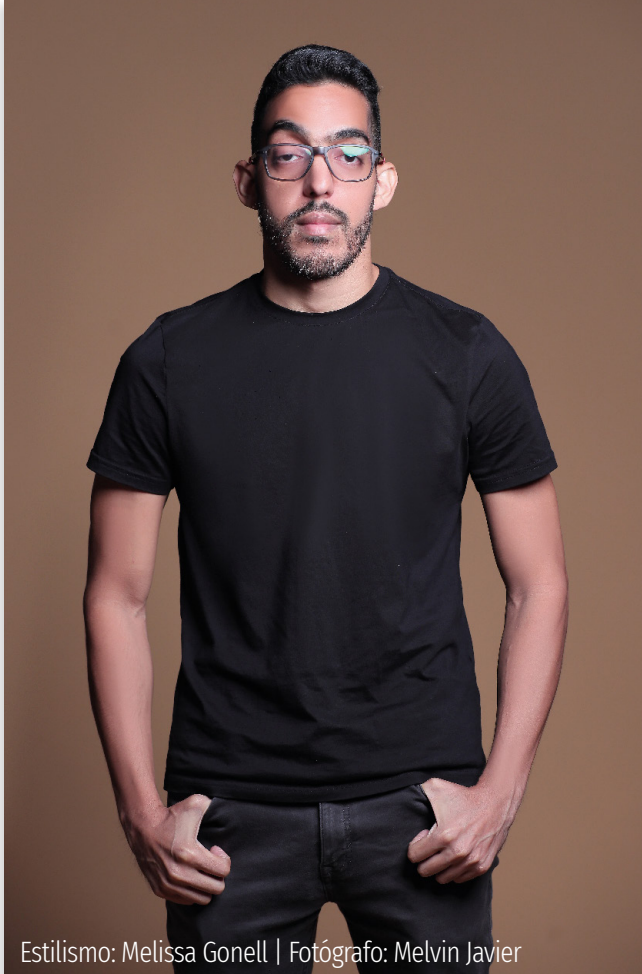
Estilismo: Melissa Gonell