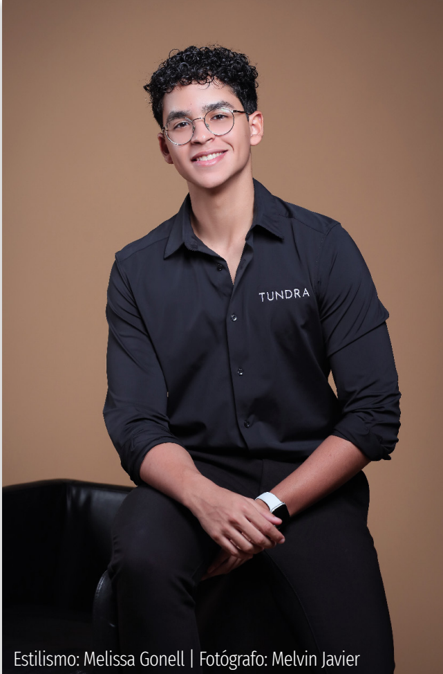
Estilismo: Melissa Gonell

Segundo lugar de Laboratorio de Mentores